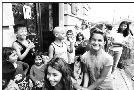
Serbische „Patenkinder“ der GBM

mer bei ihnen willkommen und können dort übernachten.