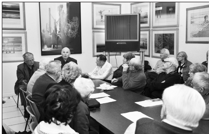
Die GBM-Geschäftsstelle in Berlin-Lichtenberg ist ständiger Ort von Ausstellungen und Veranstaltungen, mit denen unsere Organisation ihre satzungsgemäßen Aufgaben erfüllt.

Weltweit entwickelte sich Protest gegen die Kriegshandlungen der westlichen Allianz, auch von Seiten einiger Staaten, die ursprünglich durch Stimmenthaltung die Resolution 1973 im Sicherheitsrat passieren ließen – die Resolution sei ungenau in der Be-