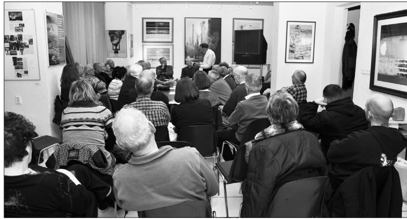
Buchvorstellungen mit zeitgeschichtlich und politisch interessanten Themen bereichern das Veranstaltungsprogramm der GBM-Geschäftsstelle.