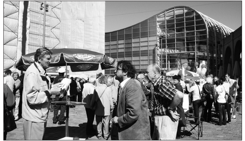
Der GBM-Ortsverband Chemnitz und Umgebung gestaltete am 1. Mai 2011 im Chemnitzer Stadtzentrum einen Infostand

paktes, die nicht im Grundgesetz der BRD, das in Deutschland höchsten Stellenwert habe, abgedeckt seien. Deshalb brauchten Gerichte und Gesetzgebung auch nicht ausdrücklich auf den Sozialpakt Bezug zu nehmen. – Die Arbeitslosenzahlen seien drastisch gesenkt worden. Die Worte „prekäre Arbeitsplätze“ oder „Aufstocker“ kamen in der Antwort nicht vor. Kurzarbeit wurde ausschließlich als nützlicher Stabilisator am Arbeitsmarkt erwähnt.