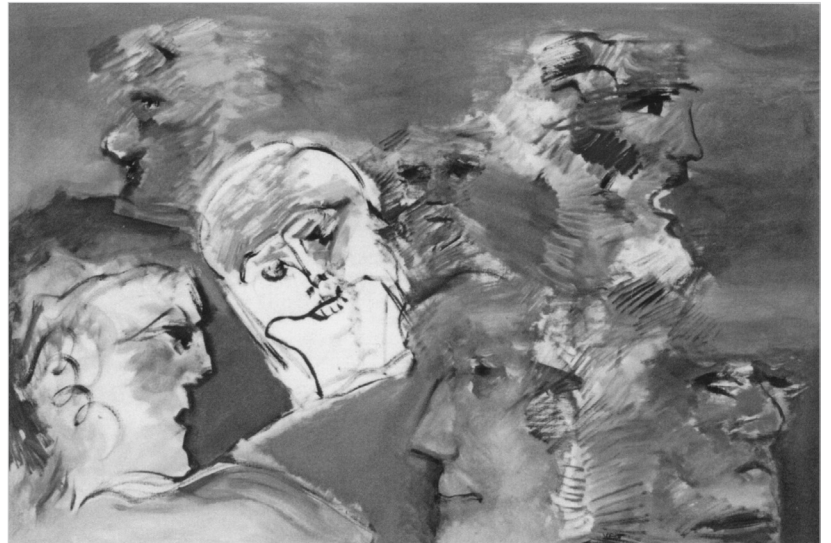
Hans Vent: Die Runde. 2002, Öl auf Leinwand, 80x120 cm

Erstens: Vent hat bewiesen, dass er ein vorzüglicher Porträtist ist; aber er weiß um die Gefahr der Idealisierung und vermeidet die Wiedergabe einer identifizierbaren Person. Er studiert uner-