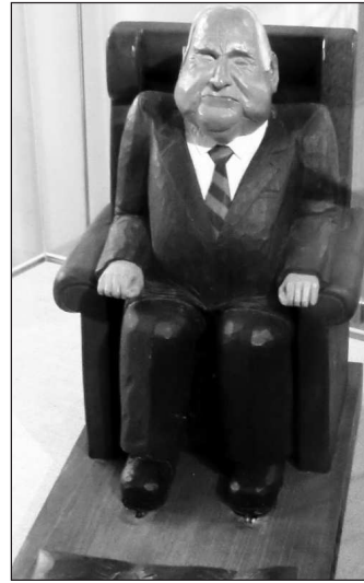
Wer diente wohl als Vorbild für diesen erzgebirgischen Nussknacker?

Guter Erfolg ist der Weltmeisterschaft 2012 im Rennrodeln zu wünschen. Der ostdeutsche Bob- und Schlittensport leidet genauso wie der Fußball am fehlenden wirtschaftlichen Umfeld und an der Unterrepräsentanz in den Vorständen der jeweiligen zentralen Verbände. Die Schätze des Gebirges sind noch nicht erschöpft. In Zinnwald befinden sich europaweit bedeutende Vorkommen von Lithium, nach dem zur Zeit alle Welt schreit. Während mediale Macht China vorwirft, die Preise dafür nicht niedrig genug zu halten, wird womöglich ein neues „Berggeschrey“ losbrechen. Doch wer wird Nutzen davon haben? Das Erzgebirge war einst ein Urmeer, dessen Kalkablagerungen nun an dieser Stelle für Jahrhunderte ergebigen Bergbau ermöglichen. Der hochprofitable Betrieb wurde unter solchen Bedingungen privatisiert, dass die Gemeinde keinen einzigen Cent an Steuern erhält! Besorgte Bürger fanden noch nicht den Weg, die Geheimklauseln, die das ermöglichen, so wie in